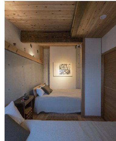
④改修後 出入口から漆喰壁になる