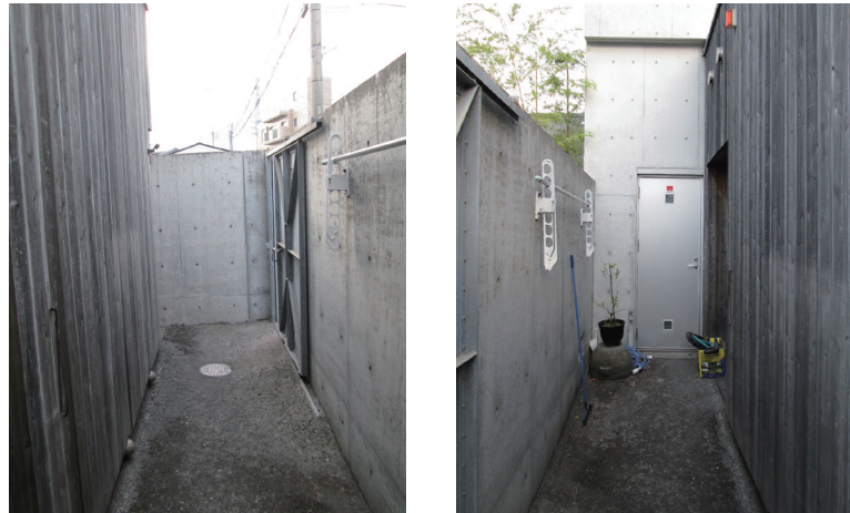
④露地への出入り口