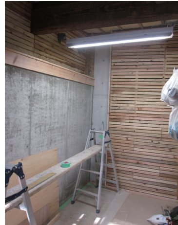
木摺漆喰工法(木摺下地) 砂漆喰施工状況