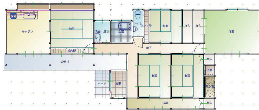
リフォーム前平面図