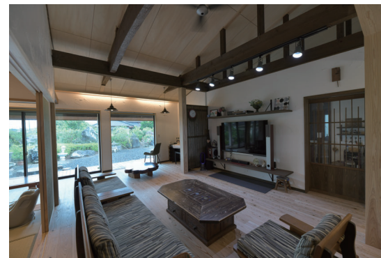
④ リビング 仕切りが多かった間取りを開放的な空間とした。