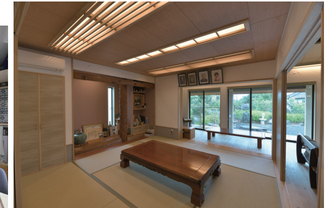
⑥ 和室 既存の床柱や落とし掛けを再利用しているだけでなくクロスを貼り分け、間接照明など、こだわりぬきました。