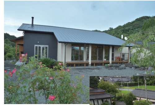
① 外観 外壁の貼り分けでアクセントをつけ、スタイリッシュな見た目に。