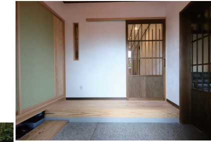
② 玄関 造作の縦格子の建具の左側には、既存の障子を一部分だけみせた洗面納戸への採光に！