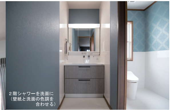
2階シャワーを洗面に (壁紙と洗面の色調を合わせる)