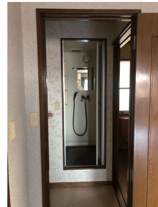
↑2階シャワーを洗面に (イメージが暗く感じた)