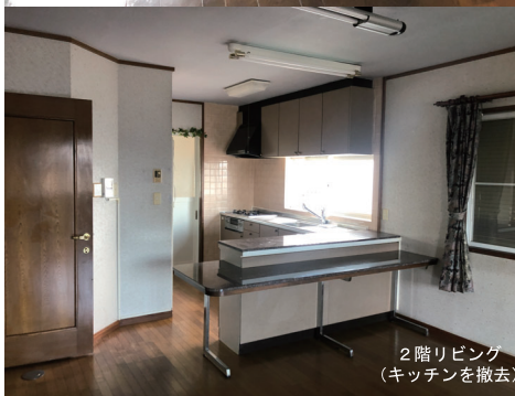
2階リビング (キッチン撤去)