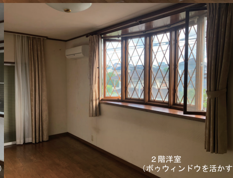
2階洋室 (ポウウィンドウを活かす)