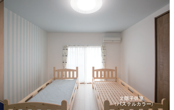
2階子供室 (パステルカラー)

既存建物の特徴としてデザインが古くて暗いイメージがありました。断熱性能もあまり良くなく、入れ替えが必要と判断しました。1階和室や2階ポウウィンドウは、面白く感じたので特徴を活かすプランニングとしました。元々、二世帯住宅だったということもあって、空間のボリュームは豊富で、とてもポテンシャルの高い中古住宅だと思いました。