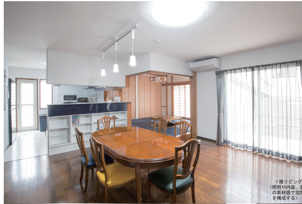
1階リビング (照明や内装、畳の素材感で空間を構成する)