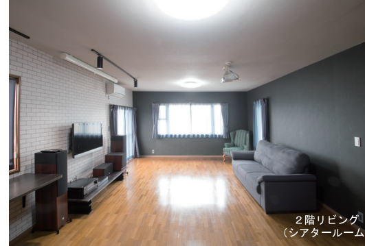
2階リビング (シアタールーム)