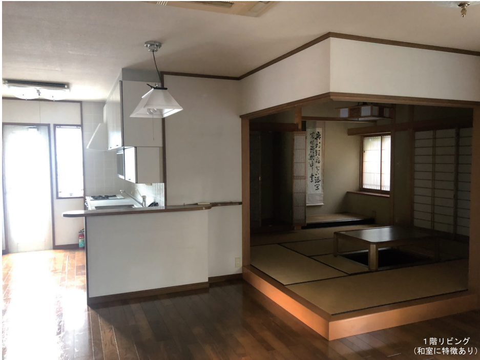
1階リビング (和室に特徴あり)