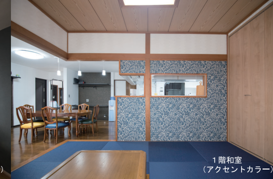
1階和室 (アクセントカラー)