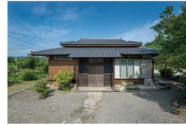
瓦・外壁の修繕、外壁は透水シート・木板（下見板）の設置