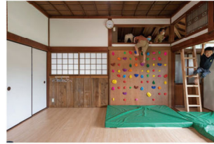
和室の畳下の木材を用いて間仕切り壁に使うことで収納やコンセント等の設置、床と外壁に面する内装の壁面に断熱材設置