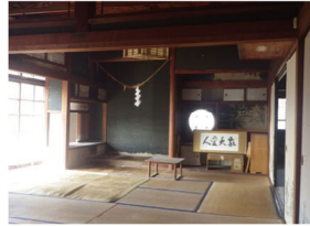
施工前床の間（書院）