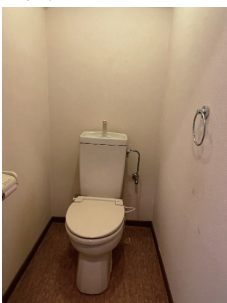
劣化が目立ち薄暗い印象