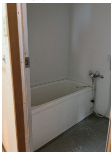
混合水栓が入居者ニーズに合わない