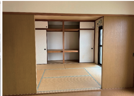
押入二間と収納が多いが窓や扉で囲まれ家具の配置が難しい和室