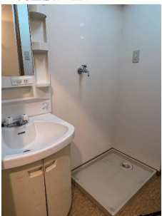
黄ばみが目立ち古さを感じる