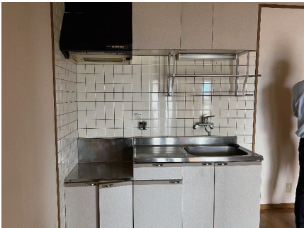
経年による汚れや傷みが見られるキッチン