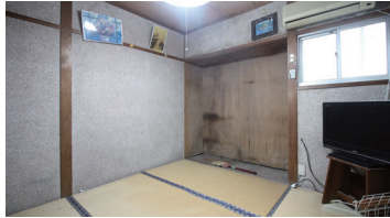
⑤ 2階和室 (窓も少なく暗い)