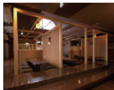
②パーティションの設置 (木製品)