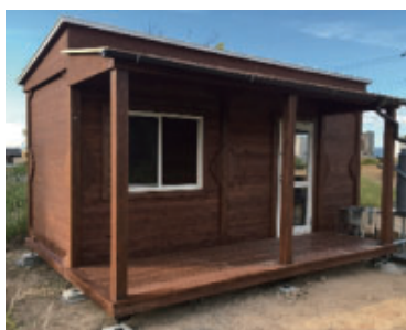
①リモート執務室設置 (増築)